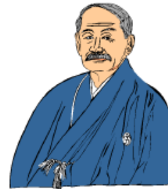
Jigoro KANO (1860-1938)

Toute sa vie, Maître Kano se battit pour faire de son art un sport universel... Aujourd'hui, c'est un sport olympique et une activité très populaire en France.